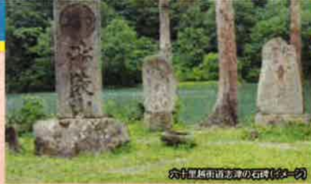
六十里越街道遺跡の石塔(左一列)