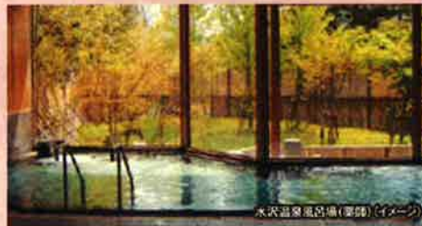
水沢温泉風呂場(露天)(イメージ)

月山にも近く、海水浴、登山、スキー等、行楽の帰りに立ち寄りやすい日帰り温泉施設です。地元産の西山杉をふんだんに使用した木造平屋建ての館内は、湯上りのひと時を気持ちよく過ごせる他、月山自然水の地ビール工場や地ビールレストランが隣接し、「湯上りに地ビールで乾杯!」できると人気です。