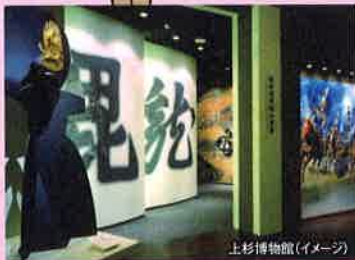
上杉博物館(イメージ)

数千に及ぶ上杉氏ゆかりの貴重な品々や国宝を収蔵し、上杉の歴史と文化を映像やジオラマ等で紹介しています。上杉鷹山の藩政改革を描いた「鷹山シアター」は必見です。