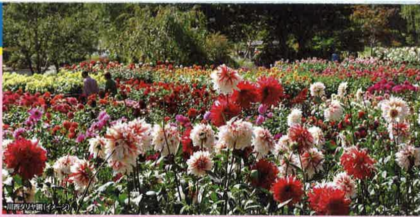
川西ダリア園(イメージ)