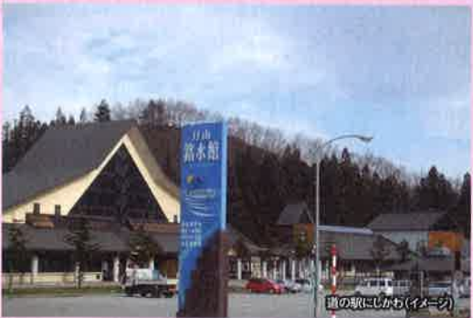
道の駅にしかわ(イメージ)