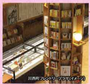
川西町フレンドリープラザ(イメージ)