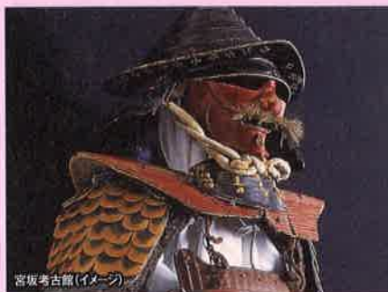
宮坂考古館(イメージ)

上杉景勝公の甲冑、前田慶次や直江兼統等の上杉家家臣団が所用したという甲冑の他、米沢藩に伝わる貴重な文化財が展示されています。