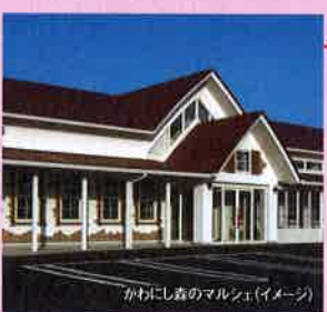
かわにし森のマルシェ(イメージ)

川西町出身の作家・劇作家である井上ひさし氏の蔵書22万冊を有する「遅筆堂文庫」を核とした複合文化施設です。