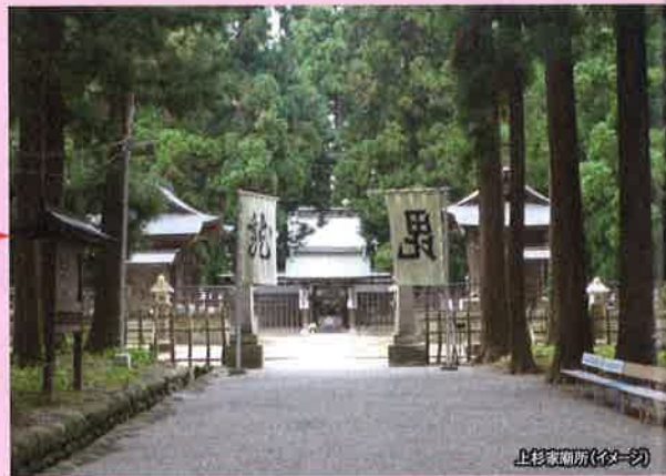
上杉家廟所(イメージ)

国指定史跡「米沢藩主上杉家墓所」で、上杉謙信公を中心に12代育定までの歴代当主の廟が整然と立ち並んでいます。