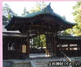
上杉神社(イメージ)

前田慶次が隠居した屋敷「無苦庵」での生活用水として掘った清水は400年間湧き出ており、今も灌漑用水として利用されています。