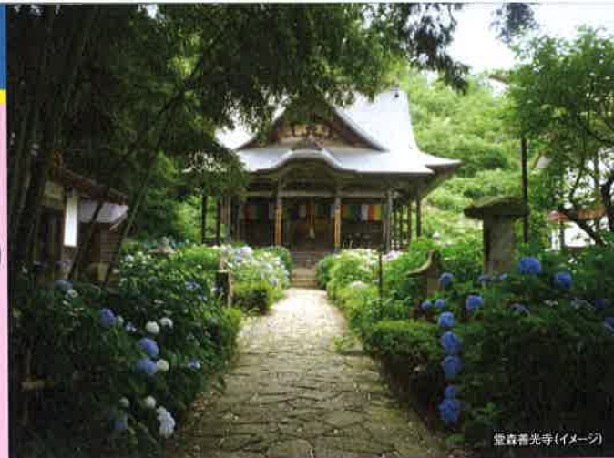
堂森善光寺(イメージ)