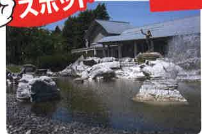
最上義光歴史館(イメージ)

造園の巨匠「岩城巨太郎」渾身の世界。国指定重要文化財の旧山形県庁舎、文翔館の庭園は市民のオアシスです。洗心庵の庭園は、石造物と数千の樹・植物に囲まれた回遊式庭園です。さら