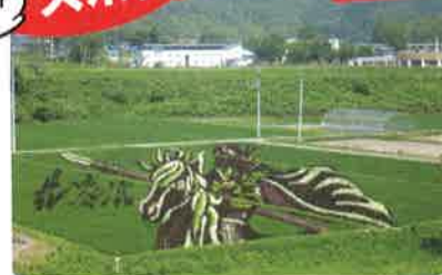
※画像は昨年の田んぼアート